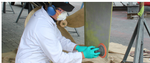
80 grit profiel (Mechanical bond)