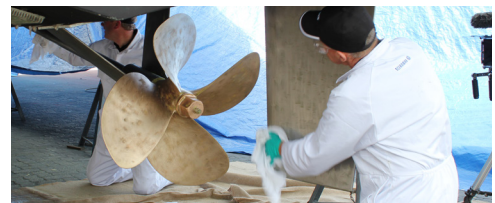
Propprep (Chemical bond)