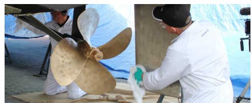
Propprep (Chemical bond)